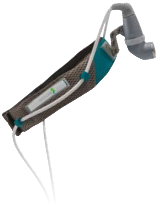
UltraLite Plus Schweißband